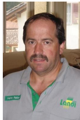
Heinz Reber Agrar